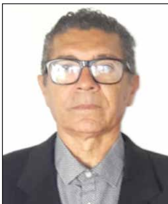
Por Adelmo Santana

As queimadas que têm destruído vastas áreas na Amazônia chamam atenção mundial são apenas a face mais visível da exploração e da degradação da maior floresta tropical do mundo. Por trás da derrubada da mata e do fogo, há diversos interesses econômicos privados que estão longe de gerar qualquer benefício ao Estado brasileiro ou de compartilhar eventuais benefícios com a sociedade. Em grande parte dos casos, essas queimadas ocorrem em terras da União, ao desabrigo da lei e sem que qualquer autorização oficial tenha sido concedida.